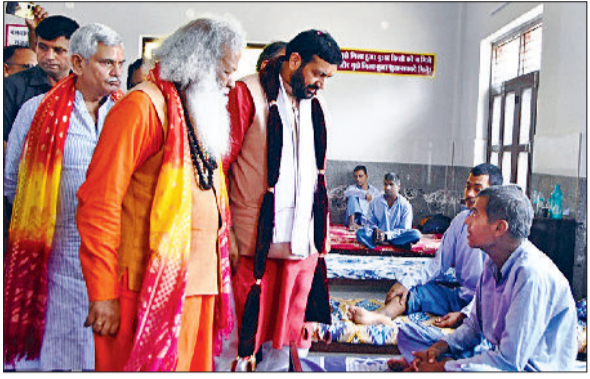
पानीपत। मुख्यमंत्री नायब सैनी, वृद्धों से मुलाकात करते हुए।

सीएम ने 21, मंत्री व सांसद ने 11-11 लाख की वॉट जनसेवा समिति संस्थान को देने की घोषणा की