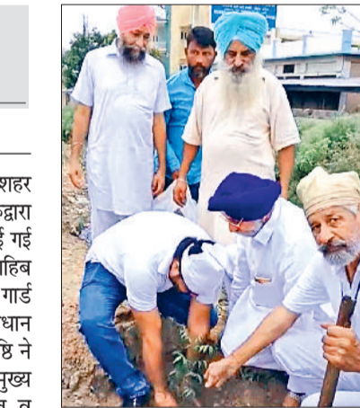
पौधारोपण करते मंच के पदाधिकारी।

सेवा सभा खुद करेगी पौधों की देखभाल हरिभूमि न्यूज अंबाला