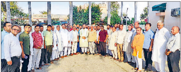
मुलाना। कार्यकर्ताओं के साथ सांसद वरुण चौधरी।

सांसद वरुण चौधरी बोले मेरी जीत का श्रेय अंबाला लोकसभा के तमाम पार्टी कार्यकर्ताओं को हरिभूमि न्यूज अंबाला