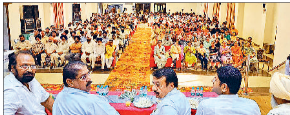
अंबाला। कार्यकर्ता सम्मेलन के दौरान मंवासीन पूर्व डिप्टी सीएम दुधत चौटाला व अन्य।

पूर्व डिप्टी सीएम दुधत चौटाला बोले 3 महीने में निर्णायक परिवर्तन लाने के लिए अथक मेहनत करें कार्यकर्ता हरिभूमि न्यूज अंबाला