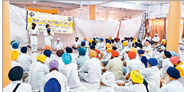
करनाल के डेरा कार सेवा में प्रदेश स्तरीय बैठक करते सिख समुदाय के लोग।

हरियाणा के सिखों ने अपने हकों को लड़ाई लड़ने का फैसला किया है। जिसे लेकर आज करनाल के डेरा कार सेवा में आयोजित प्रदेश स्तरीय बैठक में मांग रखी गई कि हरियाणा में 15-20 विधान सभा सीटों में सिख बड़ी गिनती में हैं, आने वाले विधान सभा चुनावों में यहां से सिख उम्मीदवार उतारे जाएं। अगर कोई सीट रिजर्व हो तो ऐसी सीट पर रिजर्व सिख जैसे मजहबी, रिवदासिया, शिकरीपर आदि को टिकट दी जाए। अगली लोकसभा में सिख समुदाय के दो प्रतिनिधियों को टिकट मिले व राज्य सभा में भी हरियाणा के सिख समाज को प्रतिनिधित्व दिया जाये। पंजाबी को दूसरी भाषा का दर्जा प्राप्त है लेकिन सरकारी व प्राइवेट स्कूलों में पंजाबी के टीचर नहीं हैं। पंजाबी टीचर भर्ती का रिजल्ट भी लंबित है। पिछला