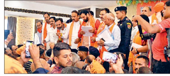
मुख्यमंत्री नायब सिंह रावर रोड पर स्थित एक निजी पैलेस में विस्तारक जिला कार्यकारणी की बैठक के उपरांत लोगों की समस्याएं सुनते हुए।